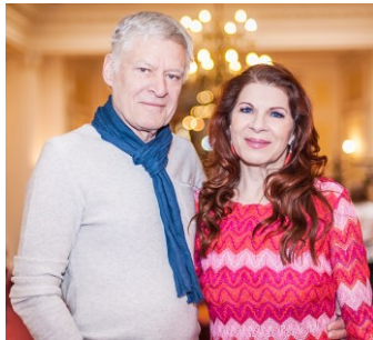
Claudia Wenzel & Rüdiger Joswig